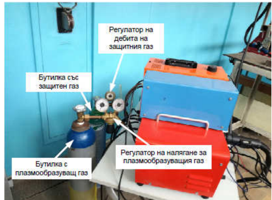
Компоненти, осигуряващи защитен и плазмообразуващ газ