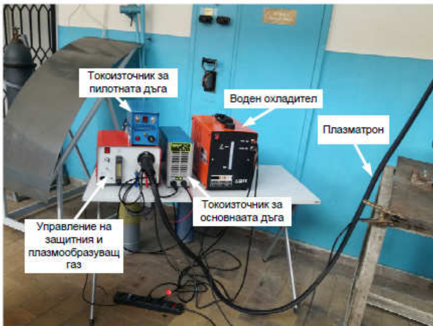
Основни компоненти на лабораторната апаратура за плазмено заваряване