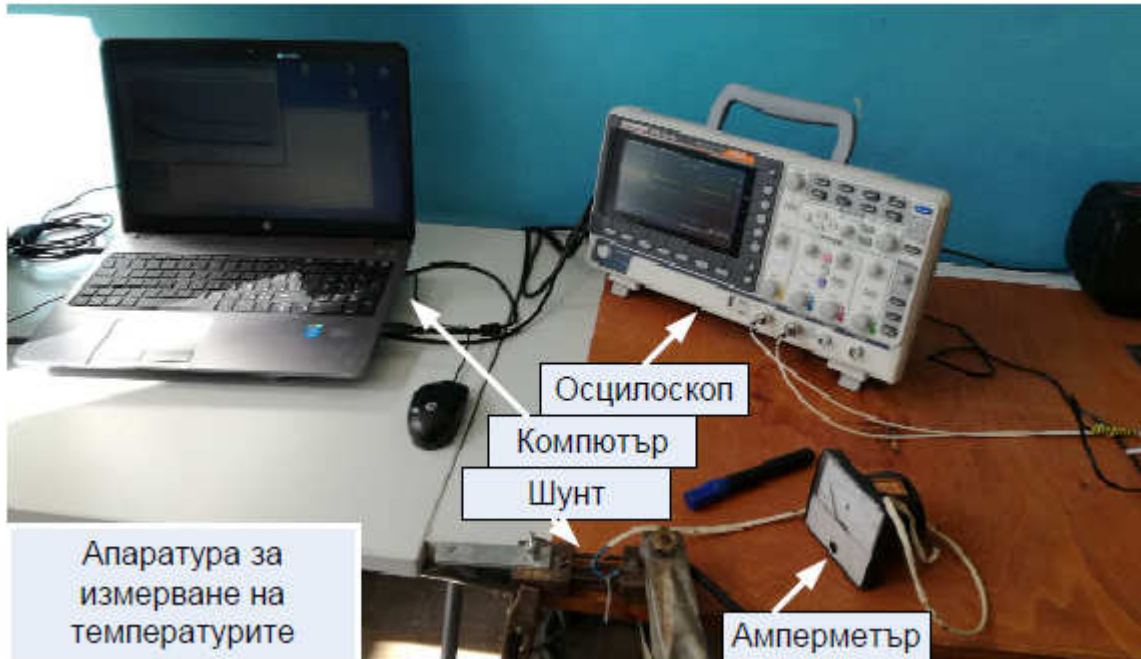
Апаратура за записване на температурите.