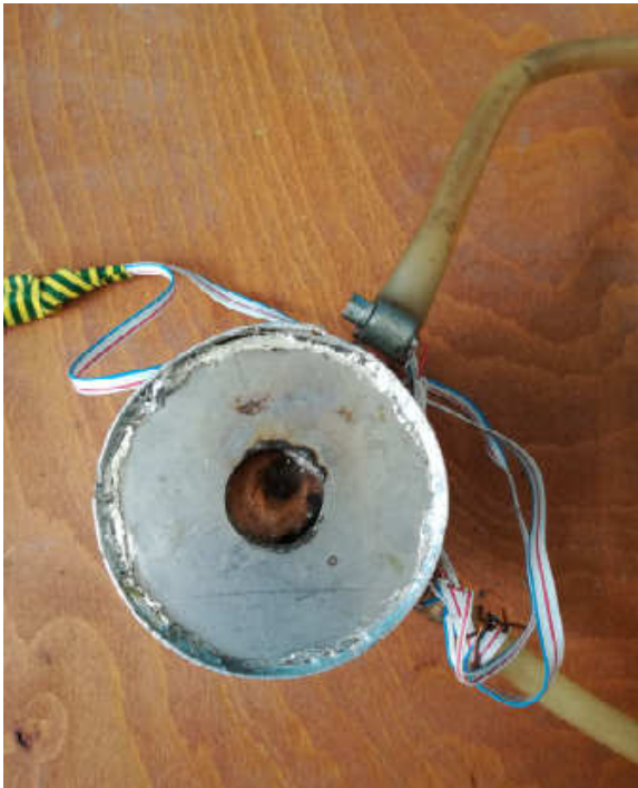
Външен вид на устройството за определяне на КПД