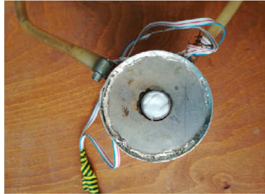
Външен вид на устройството за определяне на КПД с предпазна тапа